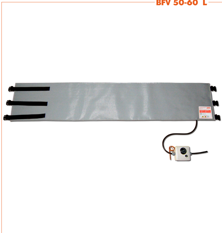
BFV 50-60 L